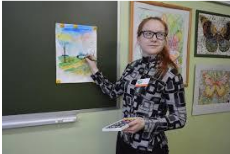
Рис. 2 Пример педагогического рисунка

Второй этап рисунка посвящён обозначению основных частей изображения головы человека в перспективном наклоне. Голова делится на 3 части – высота лба, от надбровных дуг до основания носа, от основания носа до нижнего края подбородка. Характер головы определяется особенностями строения черепных костей. На третьем этапе студенты знакомятся с особенностями конструктивного построения формы головы человека, лёгкими касаниями карандаша обозначают строение глаз, носа, губ намечают границы светотени.