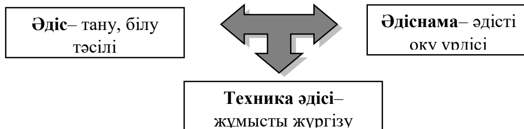
Сурет 4. Экскурсия әдістемелердің байланысы

Саяхаттанулық әдістің заты – бағдарланған зерттеу, жүйелеу, тұжырымдау, тәжірибеде әдісті қолдану және оқыту құралдары көмегімен, саяхаттанулық мамандар өзінің қызметін жүзеге асырады. Туристтік экскурсия өнеркәсіптегі мамандар үшін, саяхаттанулық теория – бұл саяхаттанулық қызметтің негізі болып табылатын теориялық ережелердің жалпы саны, оның дамуының және жетілдірілуінің негізгі бағыттарын айқындайды. Саяхаттанулық теорияда экскурсия әдісімен байланысты мәселелер маңызды орын алады. Әдіс, әдіснама және техника әдісі ұғымдары өзара байланысты болып келеді. Бұл қарым-қатынасты келесі түрде көрсетеміз (сурет 4):