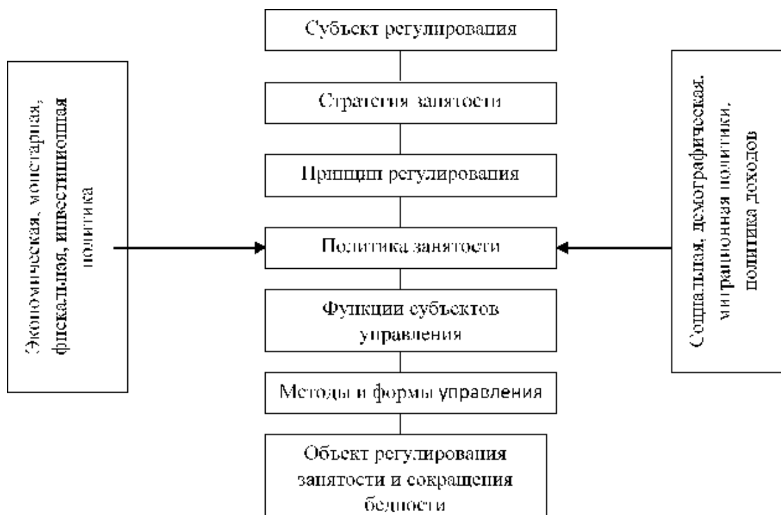
Рис.2. Институциональная модель макроэкономического регулирования занятости и сокращения бедности 8

Разработка данной модели является одной из основных задач регулирования экономики. При этом под моделью государственного регулирования рынка труда нами понимается система отношений в трудовом обмене по поводу способа формирования воздействия государства на различные параметры рынка труда. Он выражает способ воздействия государства с помощью различных форм, методов и инструментов на элементы рынка труда и факторы, влияющие на них.