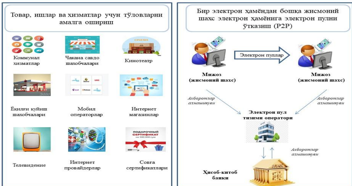
3-расм. Электрон пулдан фойдаланиш йўналишлари

электрон пуллар қабул қилиниши белгиланган.