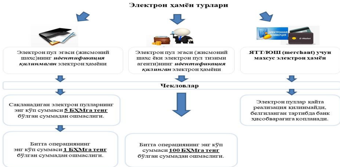
4-расм. Электрон пул тизимидаги электрон ҳамён турлари

Электрон пуллар тизимида ҳар бир электрон пуллар эгасига мазкур тизим қоидалари, электрон пулларни чиқариш, фойдаланиш ва уларни қоплаш тўғрисидаги шартнома ҳамда эмитент ва оператор ўртасида тузилган шартномага мувофиқ электрон ҳамён шакллантирилади ёки олдиндан тўланган карта (prepaid card) кўринишида эмитент, оператор ёки электрон пуллар тизимининг агенти томонидан берилади (4-расм).