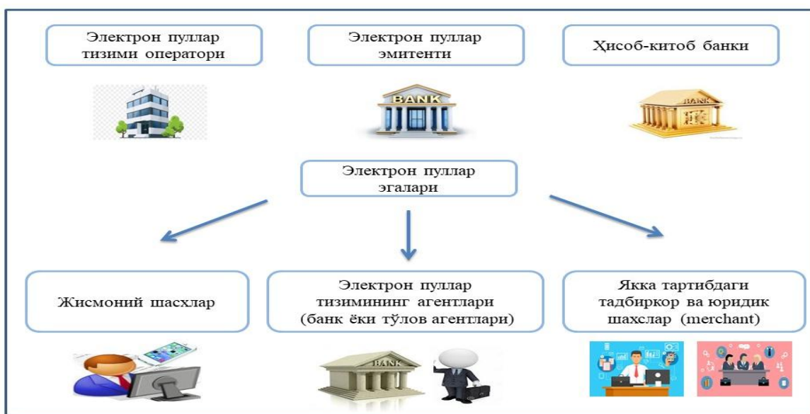
1-расм. Электрон пул тизими субъектлари

Унда электрон пуллар тизимига оид асосий тушунчалар, шу жумладан, “айирбошлаш операцияси”, “бир ва кўп эмитентли электрон пуллар тизими”, “олдиндан тўланган карта”, “электрон пуллар тизимининг агенти”, “электрон ҳамён” ва соҳага оид бошқа терминларга батафсил тушунтиришлар берилган.