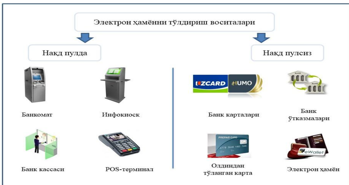
2-расм. Электрон ҳамёнларни тўлдириш йўллари

Таъкидлаш жоизки, Ўзбекистон Республикаси ҳудудида эмитент томонидан чиқариладиган электрон пуллар фақат миллий валютада номиналлаштирилган бўлиши шарт.