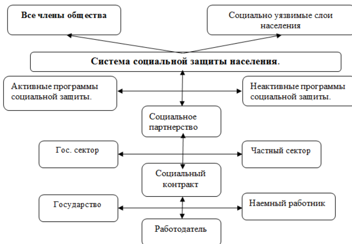
Рисунок 2. Механизм функционирования системы социальной защиты населения [2]

Социально уязвимые слои населения — это актуальная социально-экономическая и политическая проблема, присутствующая во всех странах.