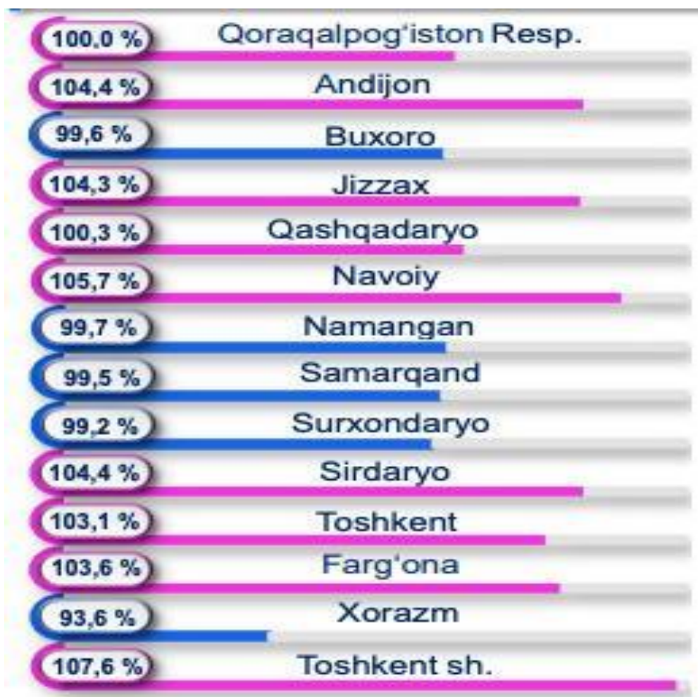
2 - jadval

O'zbekistonda 2030-yilga kelib aholi jon boshiga daromad 4 ming dollardan oshiriladi, inflyatsiya miqdori esa - 5%dan kamaytiriladi